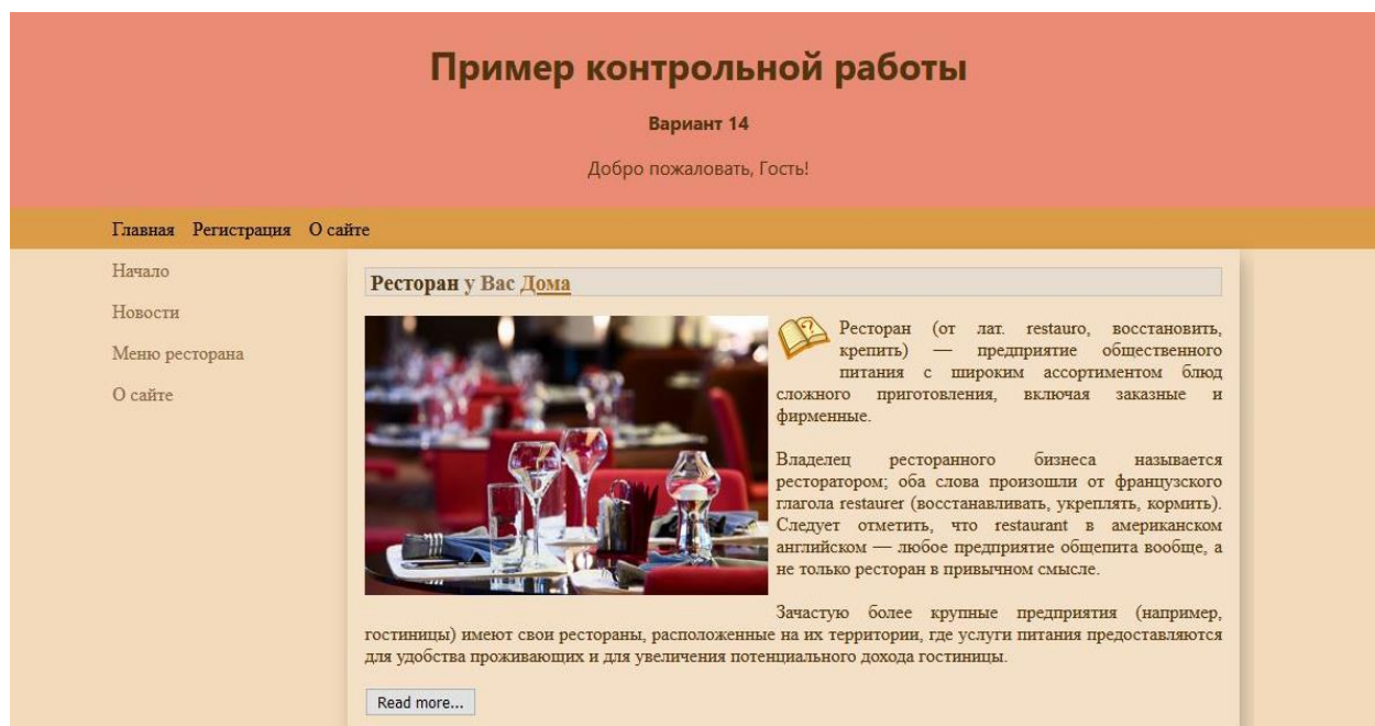
Рисунок 1 – Результат создания сайта ресторана

В результате выполнения задания были получены результаты, приведенные на рисунках 1-5.