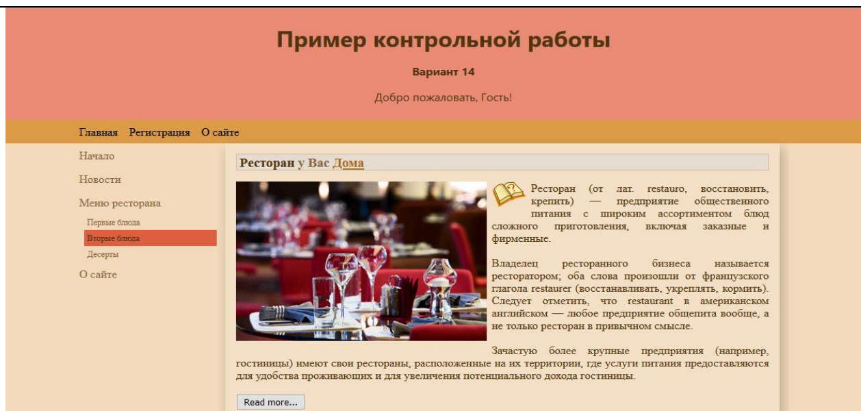
Рисунок 2 – Результат создания сайта ресторана