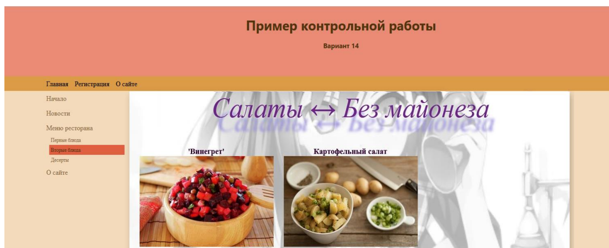
Рисунок 3 – Результат создания сайта ресторана