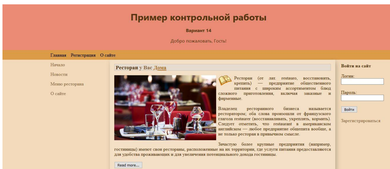
Рисунок 4 – Результат создания сайта ресторана